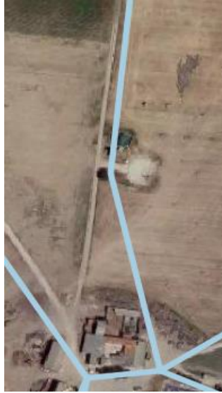
Situación actual a subsanar